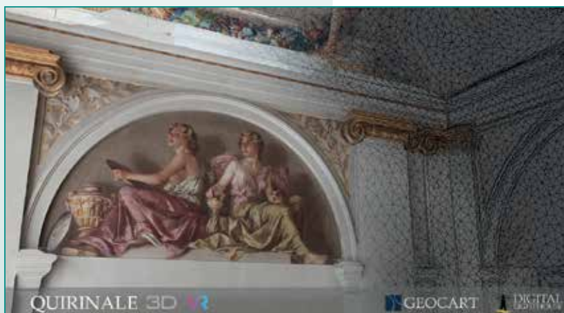
Fig. 1 – Schermata principale del software QUIRINALE 3D VR.

La soluzione tecnologica è stata sviluppata dalle società italiane Geocart e Digital Lighthouse per la valorizzazione del Palazzo del Quirinale attraverso le più innovative tecniche del Digital Heritage. Il progetto, partendo dall'integrazione tra metodologie esistenti e processi inediti per la digitalizzazione del patrimonio, ha generato un risultato unico sul piano del coinvolgimento e dell'esperienza di fruizione da parte dell'utente.