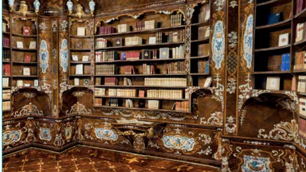
Fig. 3 – Ricostruzione 3D della Biblioteca del Piffetti.

Il software QUIRINALE 3D VR è reso disponibile attraverso il sito web istituzionale del Palazzo del Quirinale ( palazzo.quirinale.it ). L'installazione dell'applicativo sul computer consente all'utente la