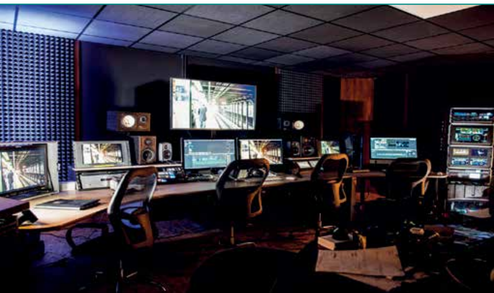
Fig. 5 – Sala di post produzione degli Studios di Digital Lighthouse

GEOCART S.p.A. - VIALE DEL BASENTO 120, POTENZA WWW.GEOCART.NET - GEOCART@GEOCART.NET