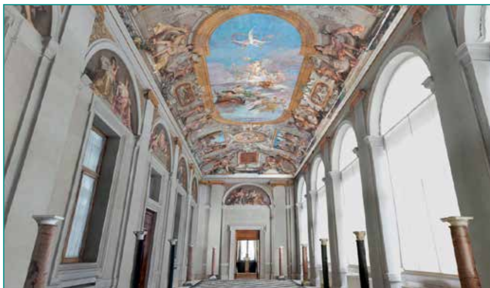
Fig. 4 – Ricostruzione 3D della Loggia d'Onore