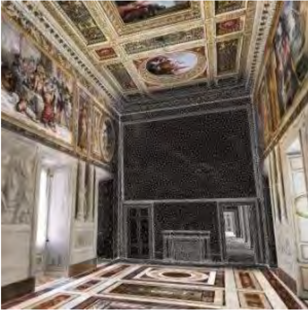
Ricostruzione 3D e wireframe della Sala degli Ambasciatori del Palazzo del