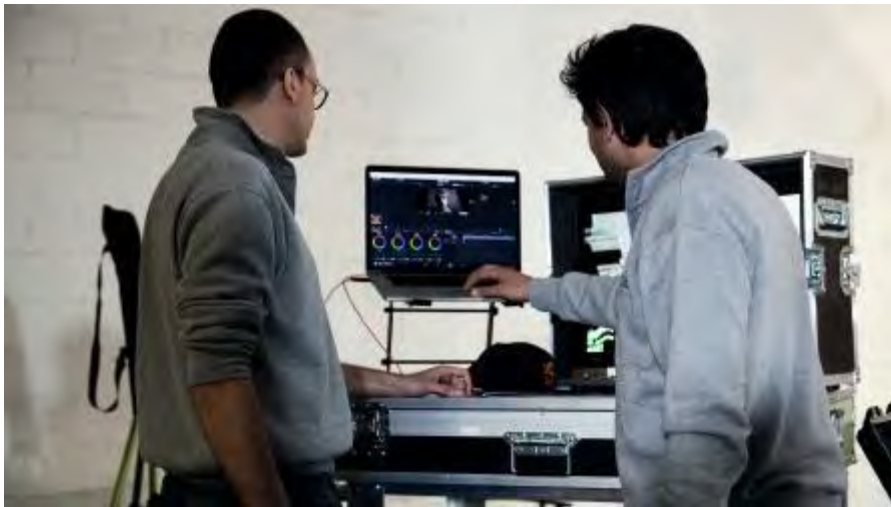
Making of di QUIRINALE 3D VR