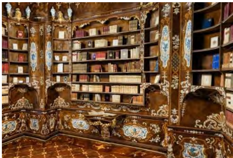
Ricostruzione 3D della Libreria del Piffetti

La complessità degli ambienti da rilevare, la presenza di fregi, stucchi e affreschi ad altezze anche considerevoli (fino a 21 metri), i frequenti cambiamenti di luce e la necessità di limitare l'invasività nelle fasi di acquisizione di dati ed immagini all'interno del Palazzo, hanno richiesto l'integrazione di diverse tecniche di rilievo per garantire la qualità geometrica, fotografica e artistica della restituzione 3D del Piano Nobile del Quirinale.