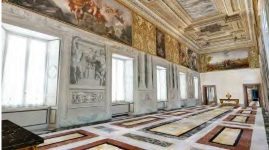
Ricostruzione 3D della Sala di Augusto