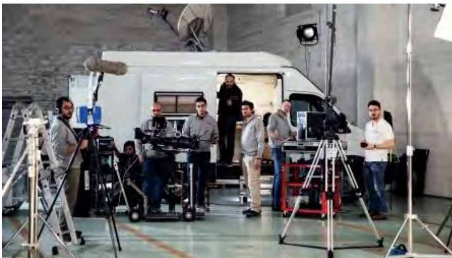
Staff Digital Lighthouse

La complessa attività di restituzione colorimetrica degli ambienti è stata gestita attraverso la stretta collaborazione tra la componente tecnica e quella artistica di Digital Lighthouse. Questa collaborazione ha portato allo sviluppo di soluzioni ad hoc per l'illuminazione di ogni singolo ambiente, alla personalizzazione delle configurazioni delle camere e delle relative ottiche impiegate e all'implementazione di una catena di software dedicata alla post elaborazione.