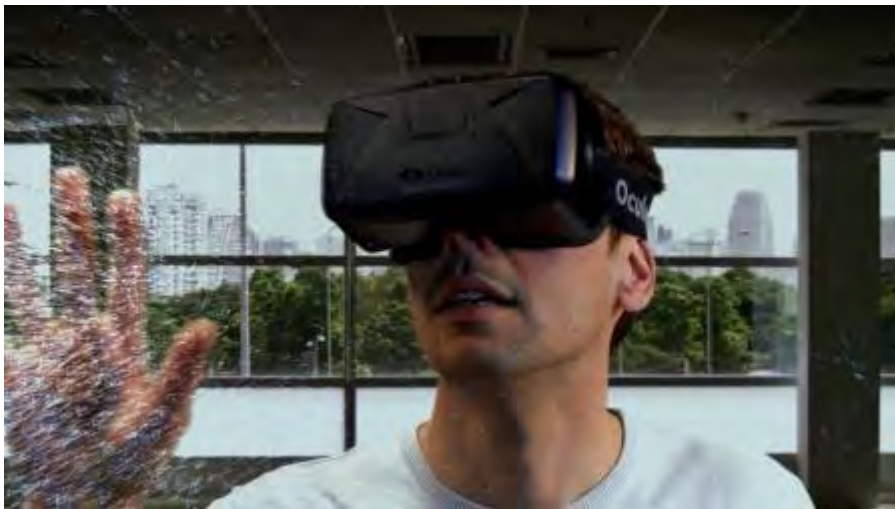
Esperienza di realtà virtuale immersiva con Oculus Rift

Visitabili solo su prenotazione, da oggi 8 delle 36 sale del Piano Nobile saranno accessibili a tutti e in qualsiasi momento della giornata. Le altre verranno rilasciate in aggiornamenti successivi. L'utente può effettuare la navigazione virtuale in modalità standard attraverso computer o in modalità totalmente immersiva mediante i visori OCULUS RIFT , speciali occhiali in grado di riprodurre in 3D ambienti interni e spazi aperti. Sarà possibile esplorare le varie sale del piano e entrare in contatto con alcuni degli arredi e oggetti che lo compongono, garantendo un'esperienza virtuale altamente coinvolgente.