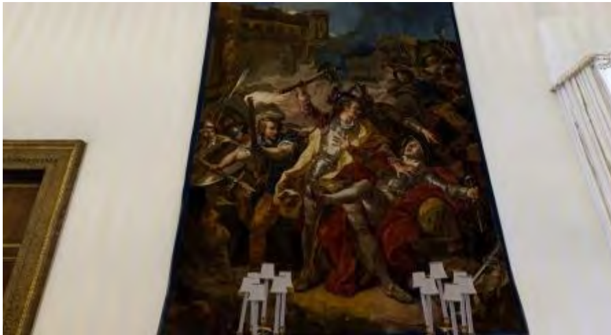
Ricostruzione 3D dell'arazzo della Sala delle Api

L'integrazione di immagini e modelli tridimensionali ad altissima risoluzione, realizzata con tecniche e metodologie appositamente studiate e implementate da Digital Lighthouse e Geocart, garantiscono un'esperienza realistica di navigazione che consente al visitatore di visualizzare qualsiasi dettaglio degli ambienti e degli oggetti e, cosa non possibile nella realtà, di ammirare da vicino soffitti e lampadari.