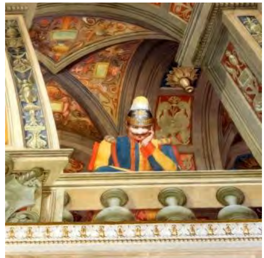
Ricostruzione 3D della Loggia d'Onore e ricostruzione 3D di un particolare del soffitto della Sala delle Logge